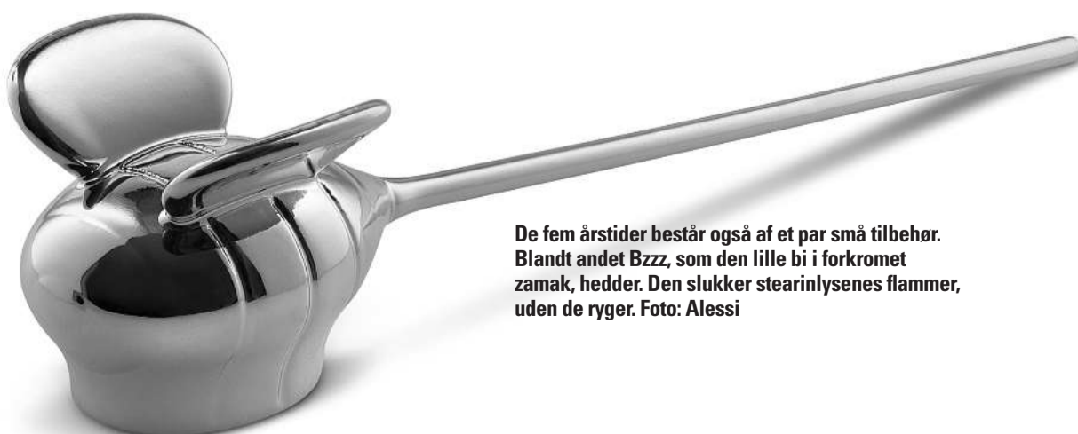
De fem årstider består også af et par små tilbehør. Blandt andet Bzzz, som den lille bi i forkromet zamak, hedder. Den slukker stearinlysens flammer, uden de ryger.