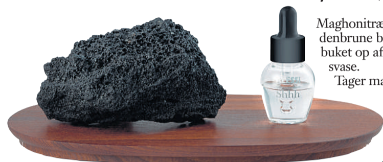
Lavastenen er en rå, æstetisk måde at sprede rose- og eukalyptus-duften af "Shhh". Foto: Alessi

Maghonitræ er skåret til tynde, gyldenbrune blade, der står som en buket op af en lille hvid porcelænsvase.