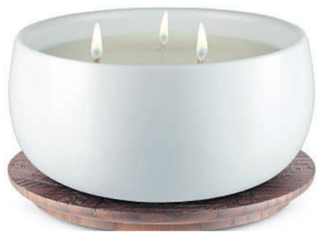
Duftserien kan købes som duftspray, porcelæn-træ-diffuser og som duftlys. Lyset er lavet af italiensk fremstillet voks. Det kan købes som stort og lille på henholdsvis 600 og 250 gram, og lyset brænder i cirka 40 timer.

- Alessi-kollektionen af dufte til hjem-