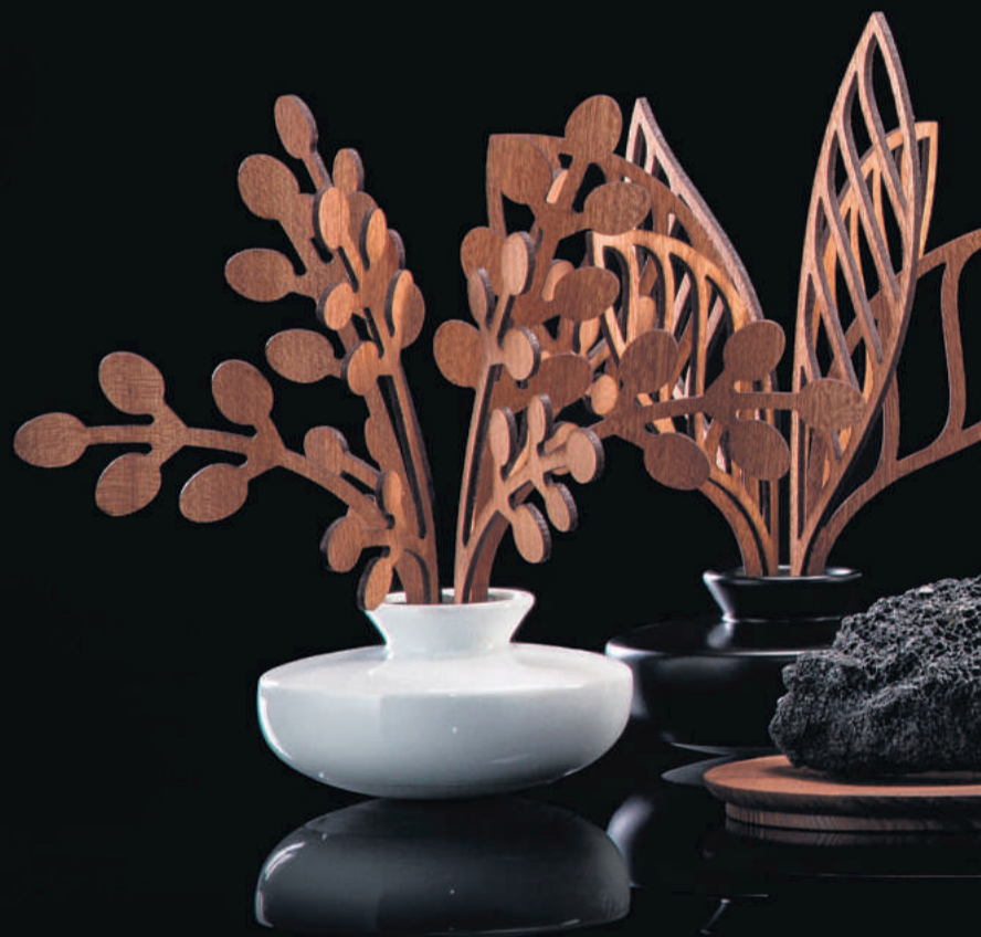
De fem årstider hedder italienske Alessis serie af duftdesign til boligen. Den er skabt af den hollandske designer Marcel Wanders, der tidligere har designet møbler for Louis Vuitton og Circus-serien for Alessi.

met inviterer os til at opdage naturens uendelighed og omfavne dens ånd i vores hjem. Intensiteten og vitaliteten af duftene hænger i luften dag og nat, og omgiver os med en oplevelse af kontinuerlig transformation. Årstidernes naturlige skiften spejler vores livscyklus: Det er derfor, vi har skabt dufte, der taler til vores sjæle, siger Marcel Wanders i en presmeddelelse fra Alessi. Designeren har fået hjælp specialister