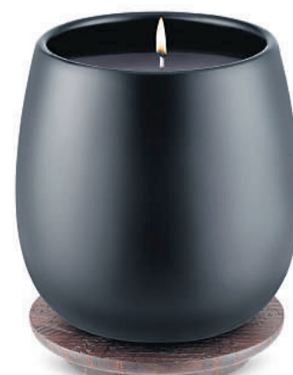
Duftserien kan købes som duftspray, porcelæn-trædiffuser og som duftlys. Lyset er lavet af italiensk fremstillet voks. Det kan købes som stort og lille på henholdsvis 600 og 250 gram, og lyset brænder i cirka 40 timer.