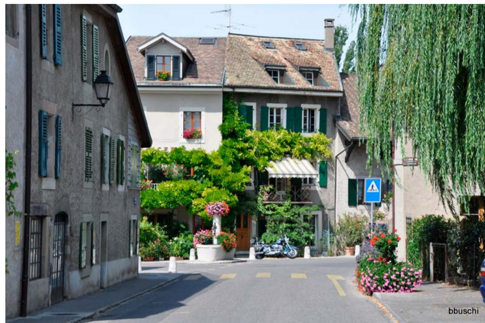
Der er sydlandsk stemning i den lille landsby Hermance, som ligger i Geneve-distriktet, men på grænsen til Frankrig.