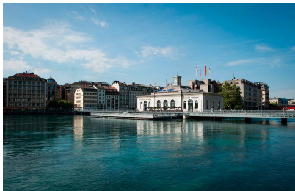
Pont de la Machine krydser Rhône-floden, midt på ligger Cité les Temps, der er et museum for Swatch-ure. Entré er gratis, og bygningen indeholder også en restaurant, der serverer schweizisk mad.

En halv time til at gå ud at spise på en af byens 9023 restauranter og en halv time til at