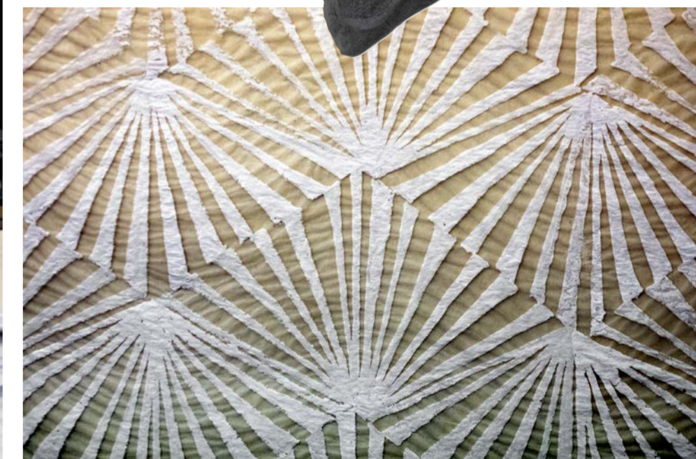
Spinkle og skræbelige er de gamle pergament-mønstre, der er blevet vævet ind i Georg Jensen Damask duge gennem tiderne.