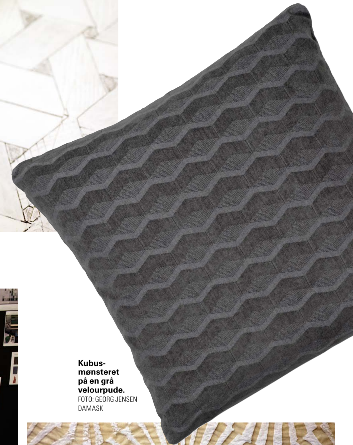
Kubus-mønstret på en grå velourpude.