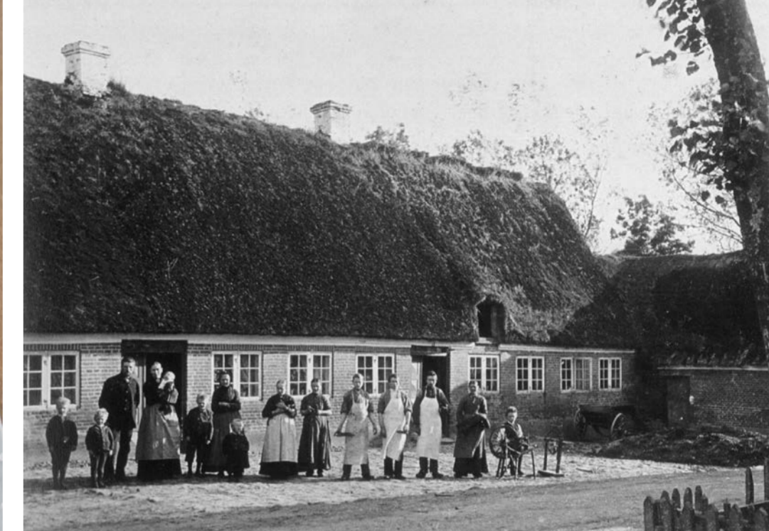
Vævergården, hvor familien startede virksomheden. Billedet er taget i 1890.