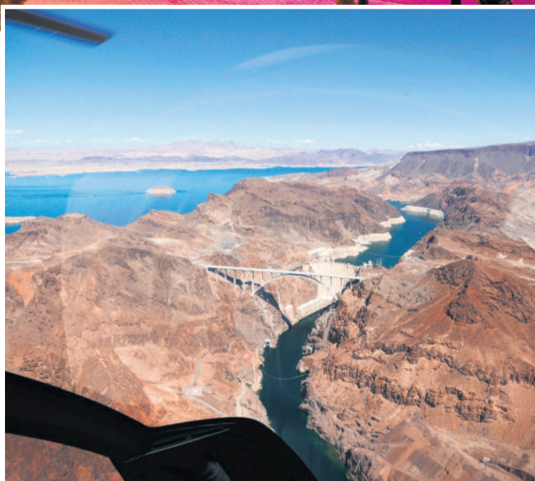
Det er meget godt, at se det hele lidt oppefra. Las Vegas er også en by, hvorfra man kan tage på naturoplevelser - som denne, der foregik i en helikopter ud over Hooverdæmningen (på billedet) og videre til Grand Canyon. Foto: Anja Limkilde

Fordelen var, at jeg var oppe tidligt om morgenen, hvor temperaturen stadig kun var på udholdelige 25 grader i skyggen. Men tænk over tidsforskellen, og hvor meget den påvirker dig, når du planlægger din tur til Las Vegas - måske skulle du blive i USA et par uger for at nå at tilpasse dig pacific standard time.