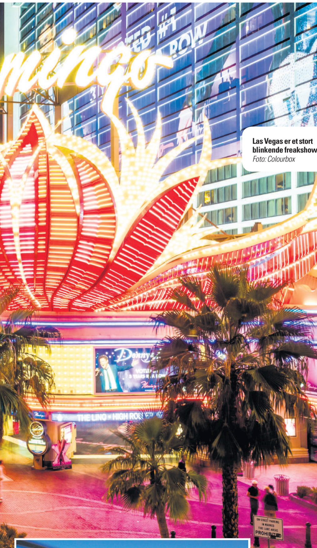
Las Vegas er et stort blinkende freakshow.