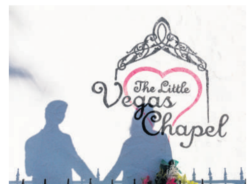
Hurtige bryllupper er populære i Las Vegas, hvor flere end 100.000 par hvert år bliver gift.

I modsætning til hvad man tror, kan man ikke bare gå fra kasino til et af byens mange bryllupskapeller for at blive gift. Der skal lidt forarbejde til at sige ja til hinanden. Man skal have en engelsksproget ægteskabsattest med fra Borgerservice hjemmefra og en ægteskabstilladelse fra staten Nevada. Den koster