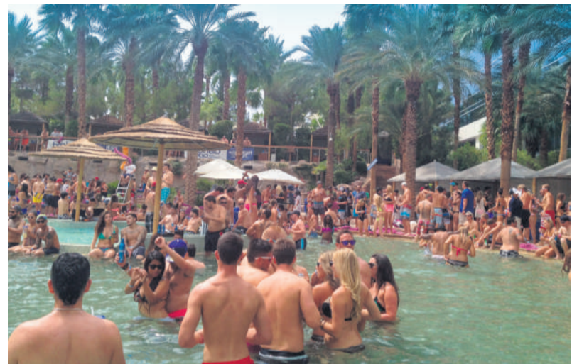
Poolparty på Hard Rock Hotel & Casino.

Det er Las Vegas i et stort blinkende freakshow, cirkus og tivoli for voksne, hvor penge forsvinder og fordobles i en lind strøm, hvor fristelser står i kø på gaden, og hvor ingen rigtig ved, hvad klokken er. Det er vidunderligt, svimlende og kvalmende på en og samme tid. Men jeg savnede godt nok en hånd at holde i for at bevare forbindelsen til jord og virkelighed. Så rejs til Las Vegas med nogen, du holder af. Du får brug for at holde fast i dem, når du kaster dig ud i pool-fester, shoppingture og kasinobesøg i syndens by.